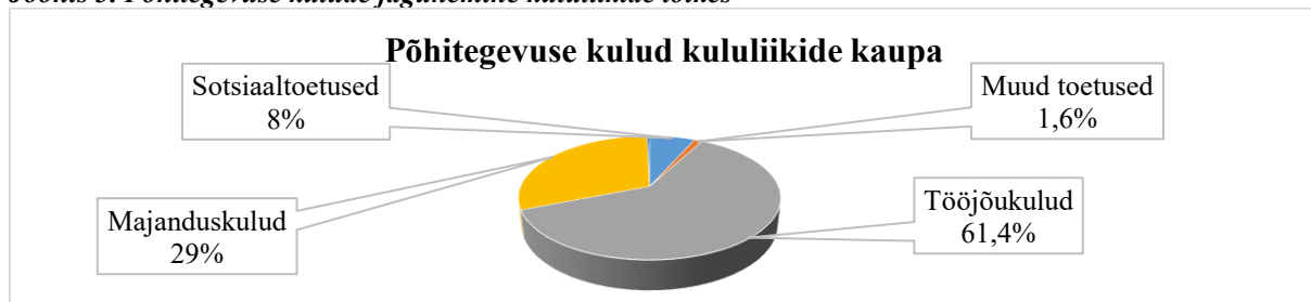
Joonis 3. Põhitegevuse kulude jagunemine kululiikide lõikes