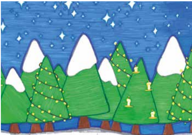
Pildi joonistas Eliisabet Roosvald, 13-aastane.