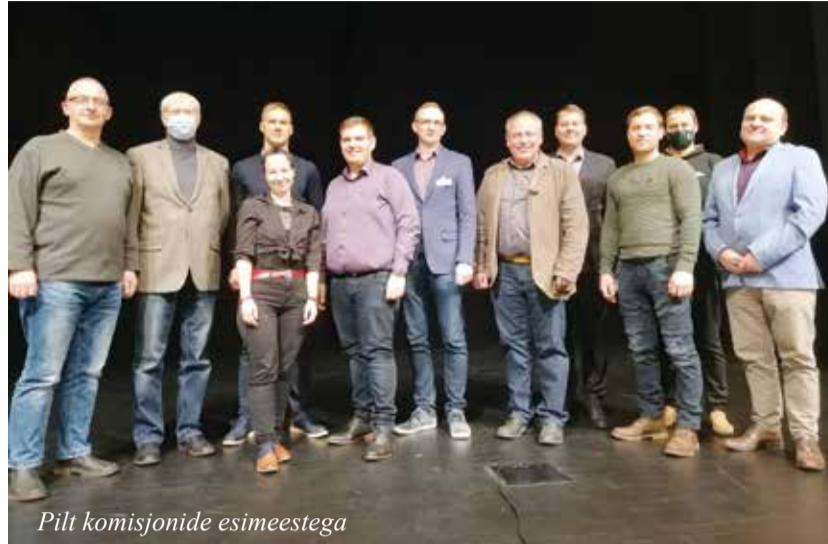
Pilt komisjonide esimeestega

Järgmine volikogu istung on kavandatud 9. detsembrile, kui päevakorras on muuhulgas osaval-