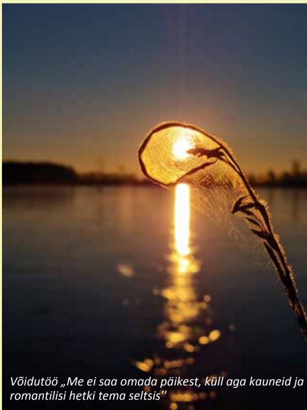
Võidutöö „Me ei saa omada päikest, küll aga kauneid ja romantilisi hetki tema seltsis“

Suur tänu kõikidele tublidele osalejatele, kes jagavad enda poolt jäädvustatud kauneid vaateid ja helgeid hetki meie kodukandist! Piltidega saab tutvuda valla Facebooki lehel.