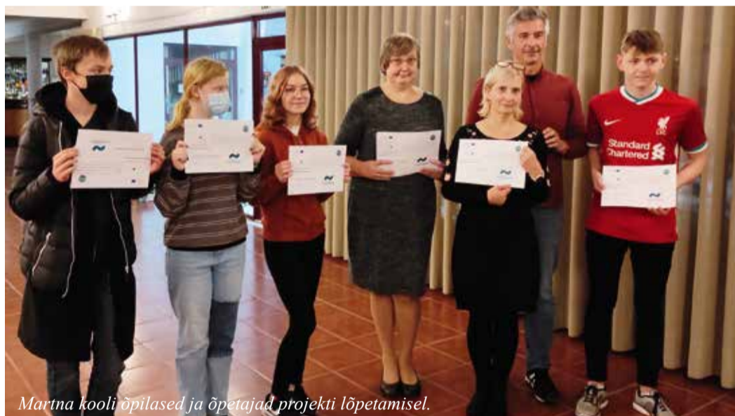
Martna kooli õpilased ja õpetajad projekti lõpetamisel.

Nelja Barceloses veedetud päeva sisse mahtusid robotika töötoad, kultuurireisid Atlandi ookeani rannikul asuvasse Portosse ja Viana do Castelo. Õpilased programmeerisid Portugali õpilaste poolt kokkupandud roboteid veebipõhises programmeerimise keskkonnas Open Roberta. Lahendati erinevaid väljakutseid: slaalomi sõit-