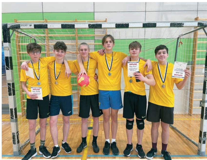
Noarootsi Kooli 7.-9. klassi poisid osalesid Läänemaa Koolispordiliidu poolt korraldatud sisejalgpalli võistlustel.

Lugemisharjumuse kujundamisega sama oluline on õpilastel iseseisva õpioskuse arendamine. Seetõttu korraldasime koolis teistmoodi õppe- ja koostööpäeva, kus 7.-9. klassi õpilased pidid kõrvalise abita saama hakkama juhendi järgi õppimisega. Sellele eelnes tihe koostöö ka õpetajatel, kelle ülesandeks sai õpilastele töökava ettevalmistamine. Olulisel kohal oli ainet omavahelise lõimimine ning päeva jaoks juhendi koostamine. Nooremates kooliastmetes kutsusime appi lastevanemaid, kes aitasid õppetegevust läbi viia – suusa-