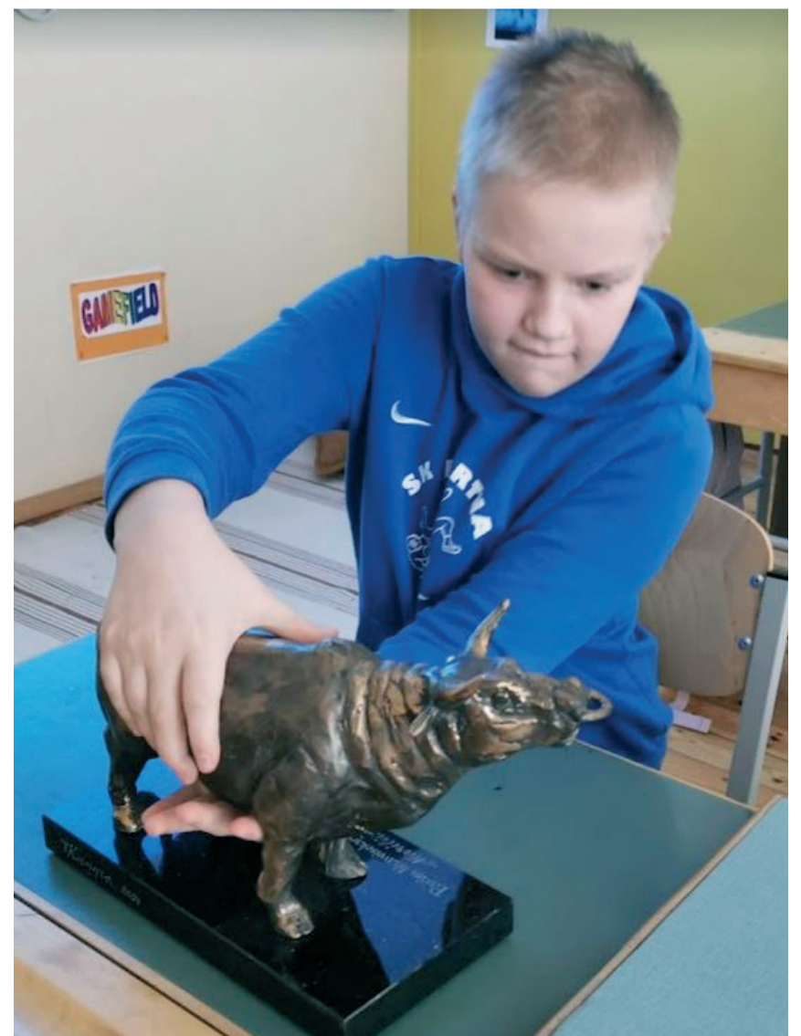
Videotuur Ohtla Lihaveis OÜs