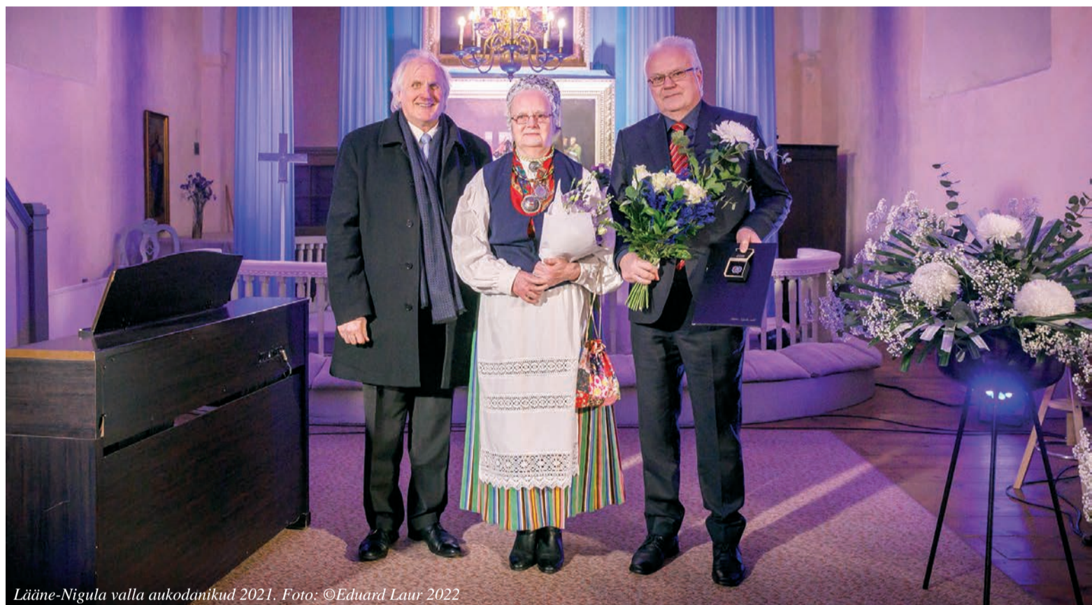
Lääne-Nigula valla aukodanikud 2021.