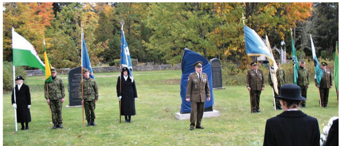
Mälestussamba avamine Kullamaal 7. oktoobril 2017.a.