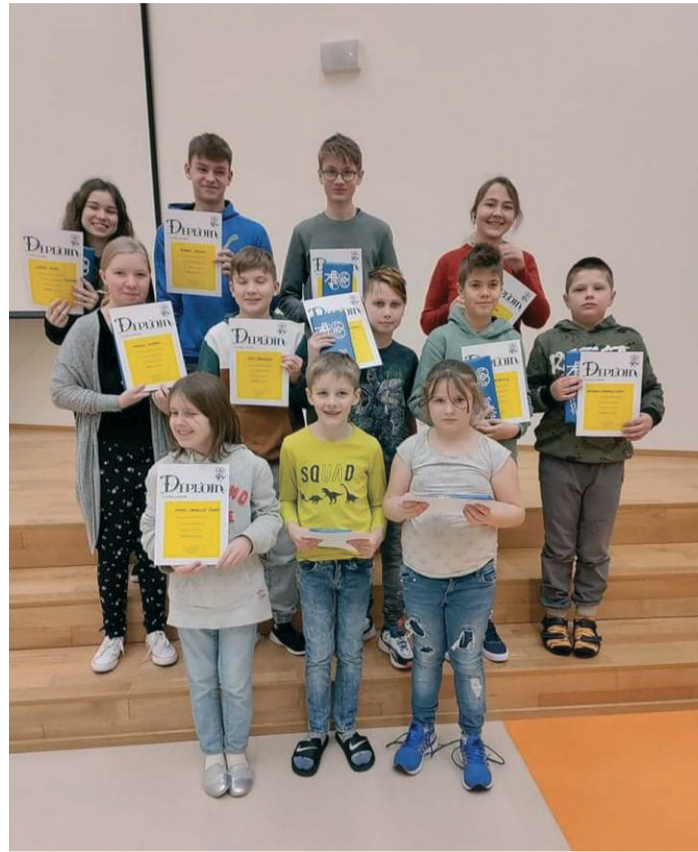
Foto: Tulid matemaatikatundjad