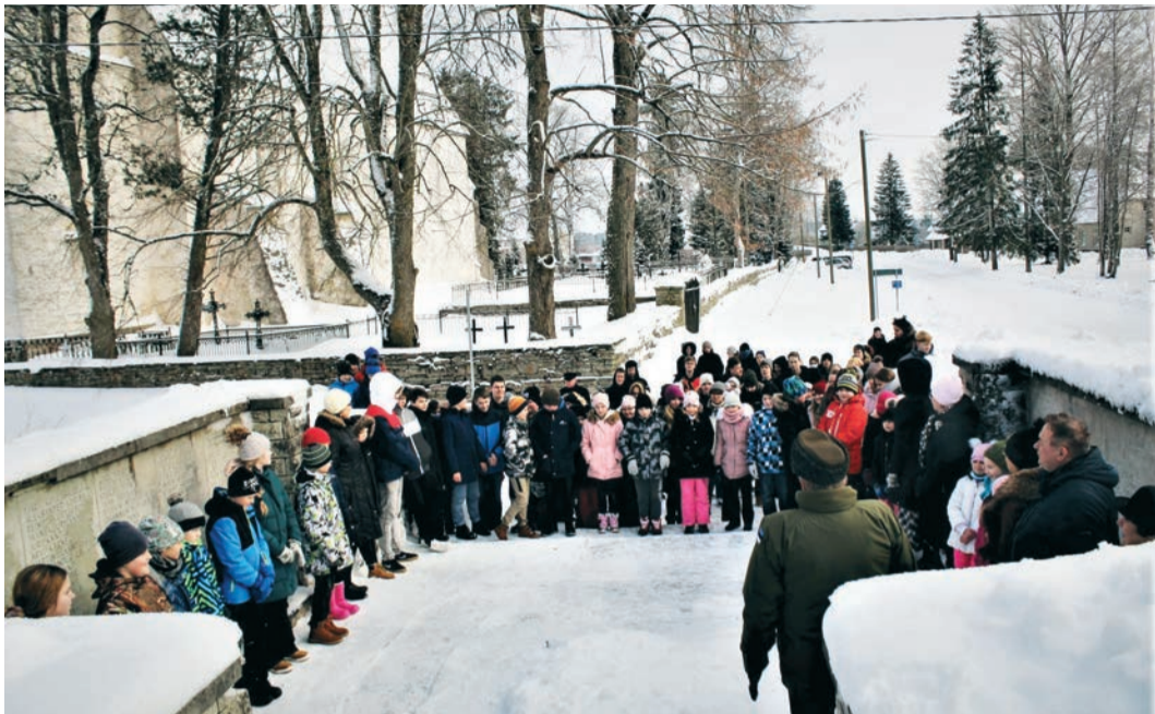
Tartu Rahu tähistamine Kullamaa vabadussamba juures