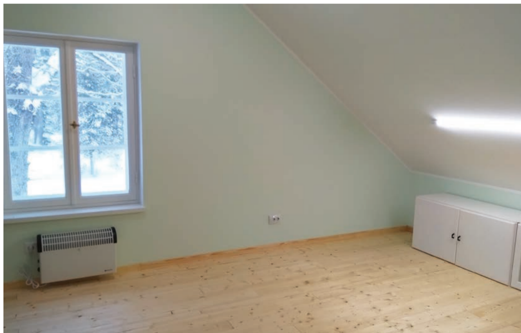
Teise korruse väljaehitamine. Pildi autor on Marje Viigipuu

Ehitustöödega alustas parima hinnapakkumise teinud Resteh OÜ juuni lõpus ning detsembri lõpuks valmis õppeklass, paigaldati katuseaknad ja kaks otsaakent, millega loodi tingimused, et teine korrus edaspidi täielikult välja ehitada. Investeeringuprojekti maksumus oli kokku 29967