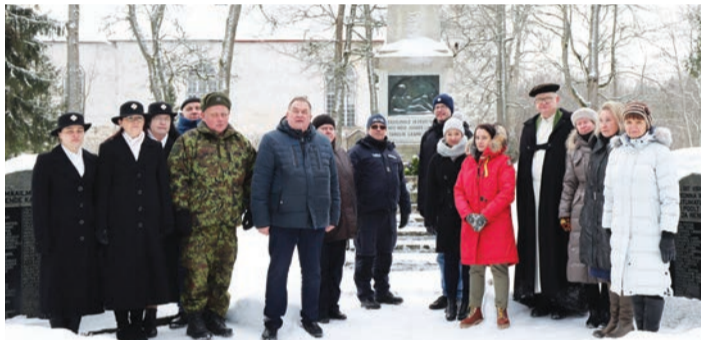
Tartu Rahu tähistamine Lääne-Nigula vabadussamba juures

2. veebruaril möödus 102 aastat Eesti ja Venemaa vahelise rahulepingu allkirjutamisest, millega Venemaa tunnustas Eesti iseseisvust ja see lõpetas Vabadussõja.